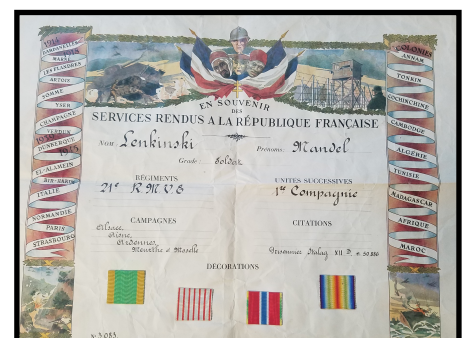
Diplôme de reconnaissance de la Légion Étrangère

appelés les régiments ficelles car les soldats étaient mal habillés, qu'ils constituaient les « restes » de l'armée et qu'ils étaient considérés comme de la chair à canon. Tout cela se passe dans un contexte particulier. En effet, les